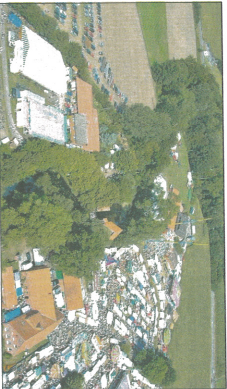
Wenn alljährlich rund 80 000 Besucher in die kleine Ortschaft Legden-Wehr strömen, ist es wieder so weit: Der Düstermühlennmarkt öffnet seine Tore – in diesem Jahr vom 25. bis 27. August.